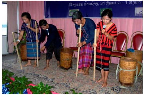
ຄະນະລະຄອນໜຸ່ມຈາກເມືອງຕະໂອຍກຳລັງສະແດງເລື່ອງທີ່ກ່ຽວກັບສິ່ງທ້າທາຍ ແລະ ໂອກາດ ໃນການສື່ສານຂໍ້ມູນຂ່າວສານ