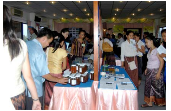
ຕະຫຼາດຂໍ້ມູນຂ່າວສານ ເປັນວິທີທາງໜຶ່ງສຳລັບການແລກປ່ຽນ ແລະ ແບ່ງປັນຂໍ້ມູນຂ່າວສານ ທີ່ຄືກັບ